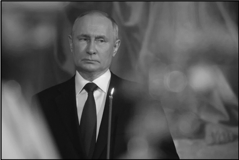
Tổng Thống Nga Vladimir Putin.

Một sản phẩm đặc trưng của chế độ cộng sản Soviet là bộ máy tố cáo, đấu tố, thanh trừng nhau. Vào ngày 30 Tháng Bảy năm 1937, từ một mệnh lệnh bí mật, Stalin đã phát động cuộc đại khủng bố (Great Terror), hay còn được biết đến là cuộc Đại Thanh Trùng ( Great Purge ) nhằm đàn áp giới bất đồng chính kiến.