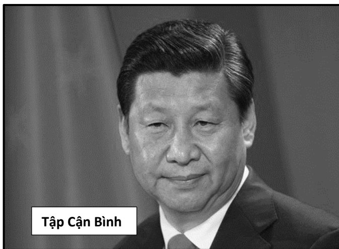
Tập Cận Bình

Bầu không khí lo sợ và nghi ngờ lẫn nhau không chỉ có ở người dân Nga, mà ngay cả ở Putin. Putin đang rất lo sợ và gần như không tin tưởng ai. Ông ta biết mình đang thua. Con điên đại của Putin có lẽ chỉ chấm dứt khi sức chịu đựng của người Nga đã cạn kiệt.